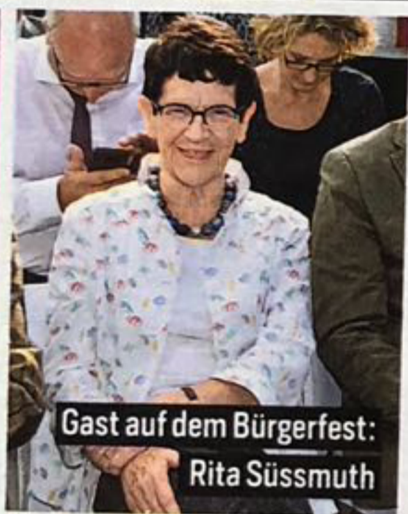
Gast auf dem Bürgerfest: Rita Süßmuth