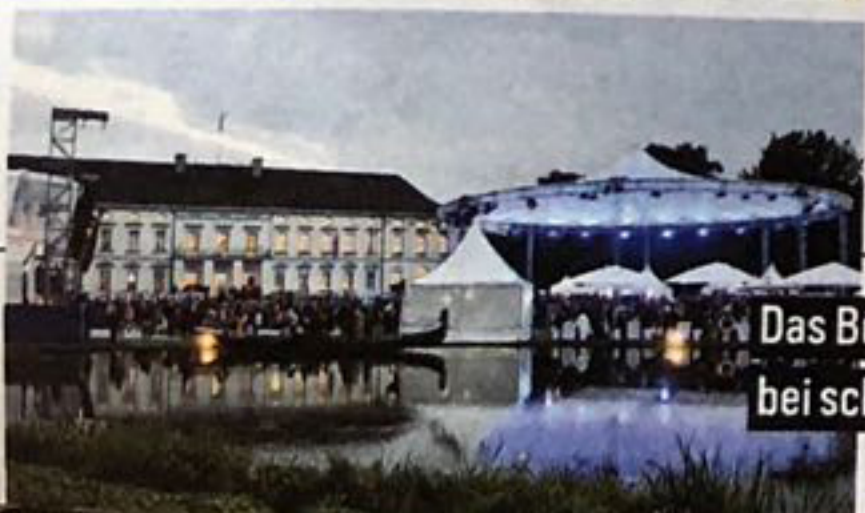
Das Bürgerfest: schöne Kulisse bei schönem Wetter