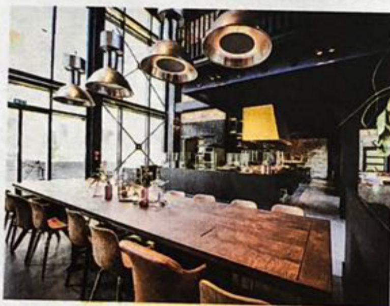
Chic im früheren Knast Es gibt Deftiges in höchster Qualität

„Wasser & Brot“ im Designhotel „Liberty“, Grabenallee 8, 77652 Offenburg; hotel-liberty.de