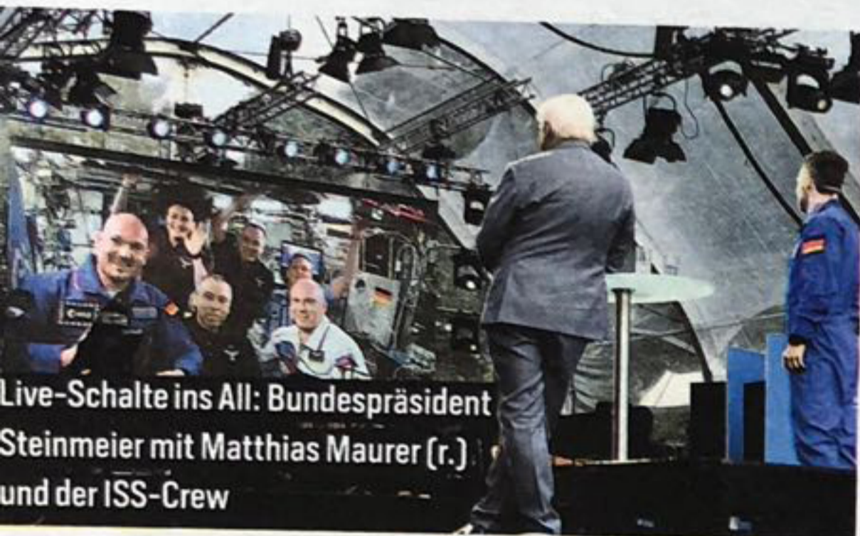
Live-Schle ins All: Bundespräsident Steinmeier mit Matthias Maurer (r.) und der ISS-Crew