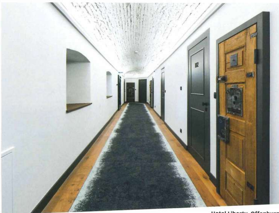
Hotel Liberty, Offenburg Früher Flure in Gefangenschaft heute Wege in die Freiheit The corridor into captivity in the past, today a path into the liberty.