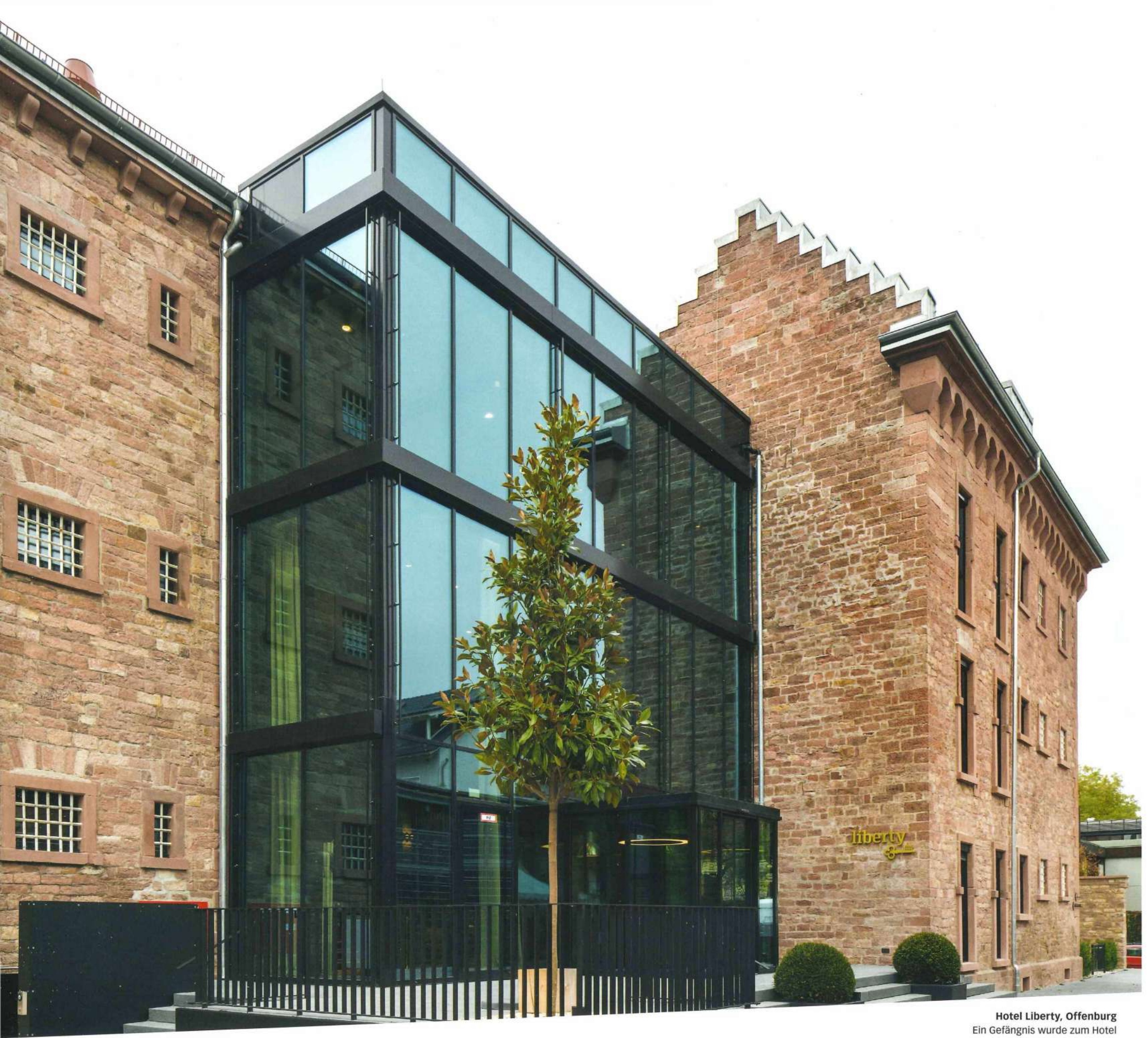
Hotel Liberty, Offenburg Ein Gefängnis wurde zum Hotel A prison became a hotel