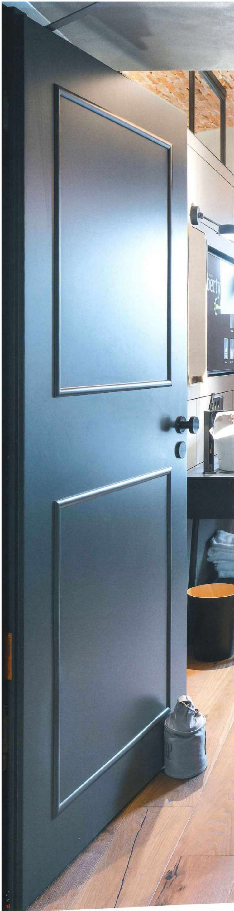
Hotel Liberty, Offenburg Hotelzimmereingangstüren mit SSK 2 RWP=37 dB Hotel room entrance door with SSK 2 RWP= 37 dB