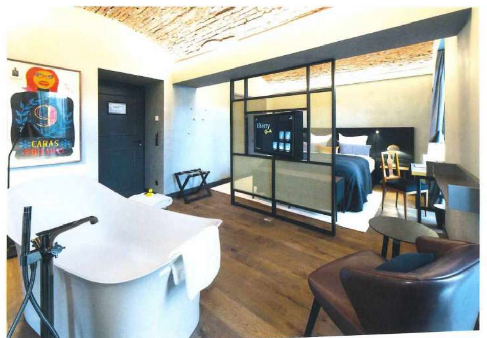
Hotel Liberty, Offenburg Die Qual der Wahl: Uriges Gewölbezimmer oder luftige Dach Suite Spoilt for choice: Rustic vault room or airy and open rooftop suite.