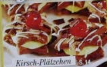
Kirsch-Plätzchen S. 14