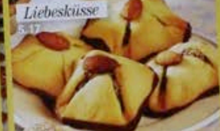
Liebesküsse S. 17