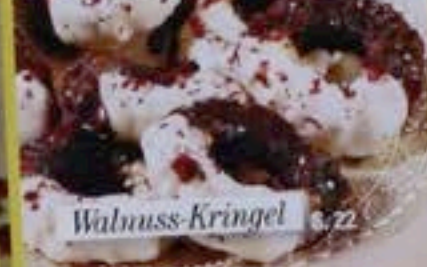
Walnuss-Kringel S. 22